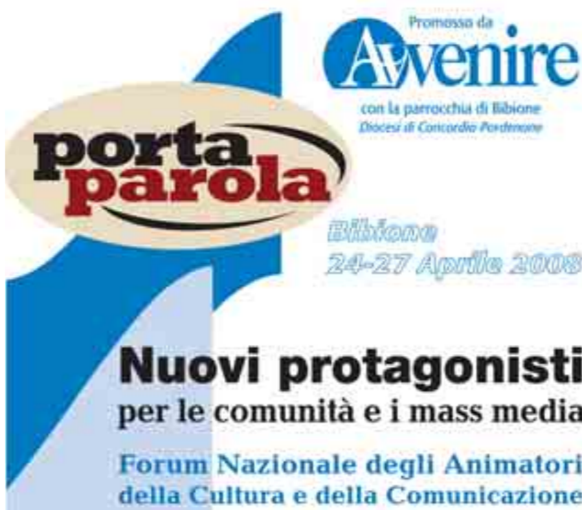
Il manifesto del convegno di Bibione, promosso da «Avvenire» con la parrocchia locale