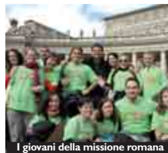
I giovani della missione romana

riconciliazione. Esortati a rispondere alla Sua chiamata dalla provocazione: «Perché partecipi alla missione? Che cerchi?». Sabato, dopo aver meditato la Spes Salvi del Papa, riceviamo il mandato missionario dal cardinale Vallini. Una frase: «La vostra missione sia profezia!», cioè testimoniare con la vita che Gesù è vivo perché la Sua Parola di verità si incarna in noi. La luce entra ancora nelle tenebre e ci salva. Nella gioia iniziamo la missione a Piazza Navona con l'adorazione e luci nella notte. L'adorazione dalle 10 alle 24, ha sostenuto la missione nelle scuole, in strada, negli ospedali e in Chiesa. Due a due a evangelizzare, come