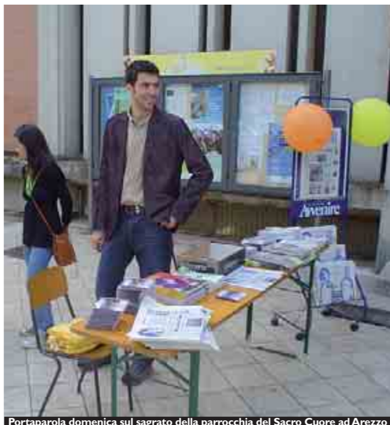
Portaparola domenica sul sagrato della parrocchia del Sacro Cuore ad Arezzo