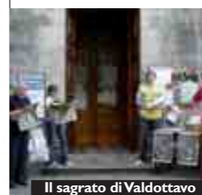
Il sagrato di Valdottavo

Il dopo Bibione, anche a Valdottavo, è carico di entusiasmo e ottimismo: siamo tornati nel nostro piccolo paese toscano con una gran voglia di fare e con tanti progetti in mente. La nostra è l'unica parrocchia, in diocesi di Lucca, a portare avanti il Portaparola. Ne siamo orgogliosi: andiamo avanti con caparbietà e con buona volontà perché, come il "nostro don", crediamo nel progetto.