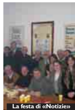
La festa di «Notizie»

Notizie (che ha festeggiato il millesimo numero dopo ventidue anni di vita). Sono i tre strumenti "ponte" che consentono anche a una piccola comunità di accedere al villaggio globale della comunicazione. Parallelamente l'Ufficio ha iniziato a tessere la rete dei comunicatori, coloro cioè che a livello periferico promuovono la diffusione del settimanale diocesano, realizzano i bollettini, animano le sale della comunità o sono alle prese con le molteplici opportunità offerte